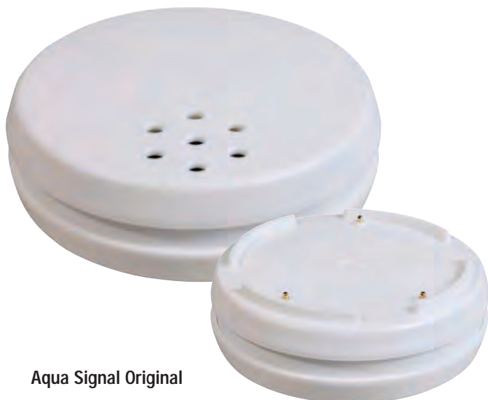
Aqua Signal Original

Vatten är dyrbart. Vattenskador vid såväl läckage som översvämningar samt onödigt vattenspill förorsakar stora kostnader. Självrisken vid vattenskador kan idag vara över 100.000 kronor! Nu finns äntligen AquaSignal som på ett enkelt, effektivt och billigt sätt hjälper dig att spara stora kostnader.