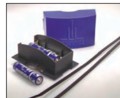
Aqua Signal Felson BVS 1-10