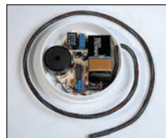
Aqua Signal Original W1311 + FS1